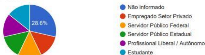
Solicitantes PF - Profissão