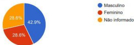
Solicitantes PF - Sexo

Por faixa etária, os solicitantes se identificaram 28,6% (vinte e oito vírgula seis por cento) se identificaram como até 29 (vinte e nove) anos, o mesmo percentual segue para os considerados na faixa etária entre 30 e 39 anos; 14,3% (quatorze vírgula três por cento) se identificaram na faixa etária entre 40 e 49 anos. Os outros 28,6% (vinte e oito vírgula seis por cento) não informaram.