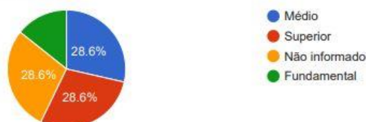
Solicitantes PF - Escolaridade

Na categoria por profissão, os solicitantes se identificaram como sendo 14,3% (quatorze vírgula três por cento) sendo Empregado Setor Privado, Servidor Público Federal, Servidor Público Estadual, Profissional Liberal/Autônomo e Estudante. Já 28,6% (vinte e oito vírgula seis por cento) não souberam informar.