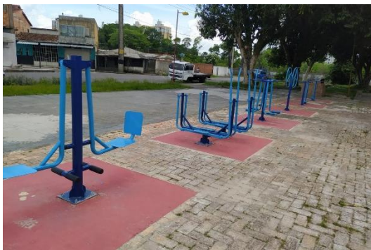
BENEVIDES (PRAÇA SANTOS DUMONT)